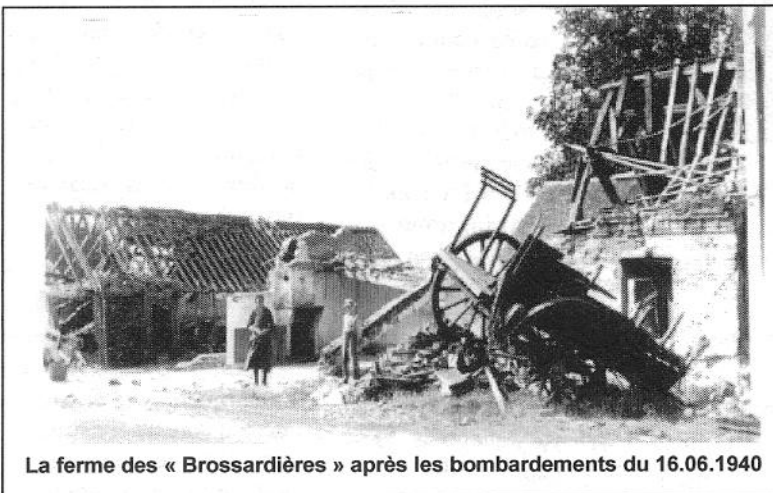
La ferme des « Brossardières » après les bombardements du 16.06.1940

Le dimanche 16 juin, l'exode continue, mais ... Les premiers avions allemands ont bombardé Orléans autour des ponts à