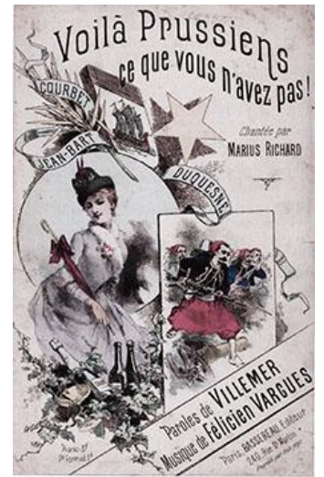
Fig. 120 - Partition musicale Voilà Prussiens ce que vous n'avez pas ! paroles de Villemers.