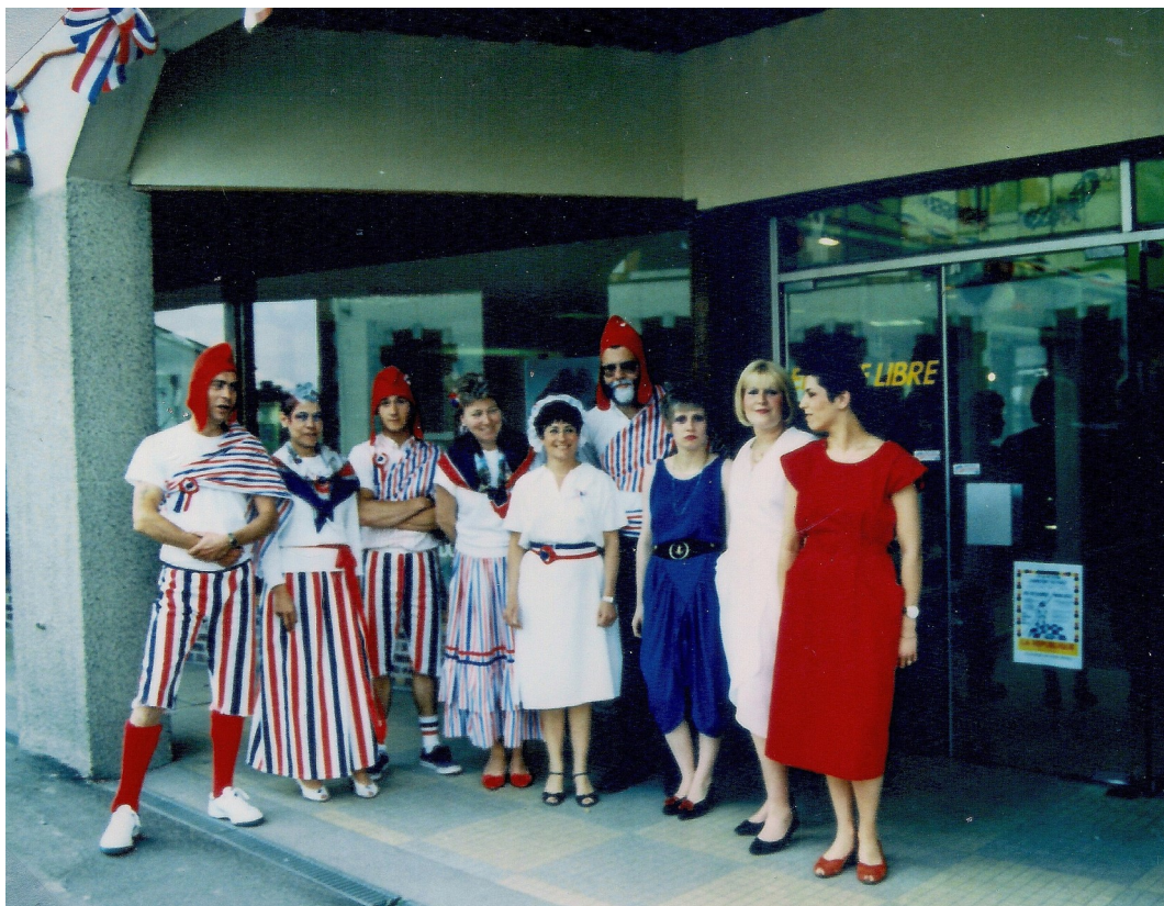
Les commerçants de l'Espace Mercure réunis pour la photo pendant la semaine commerciale de 1989.

et pour quelques temps M me Sophie Carpentier qui s'installe en septembre 2005 dans un local d'une cinquantaine de m 2 pour y exercer une activité de tapissière.